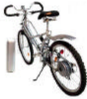
Le 601 et sa batterie détachée